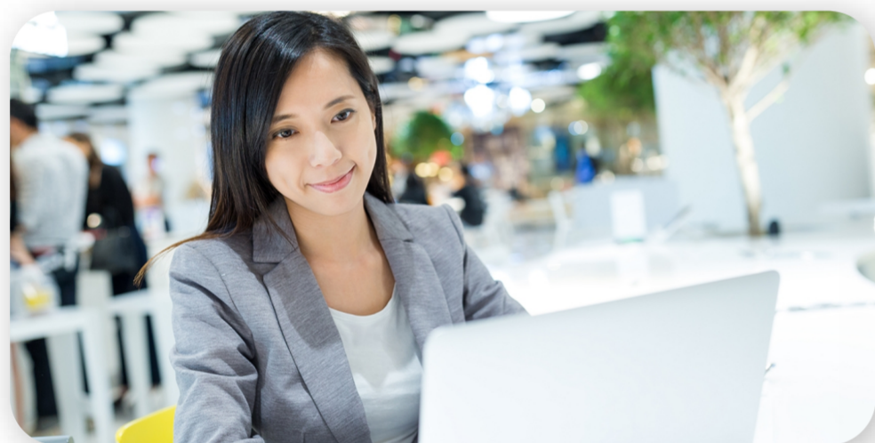
在宅勤務者との打ち合わせもスムーズに

ストレスを感じさせない映像と音声品質、ユーザーのリテラシーに依存しない操作性を実現。 ぜひ、Zoom Meetings（有償版）を体感ください。