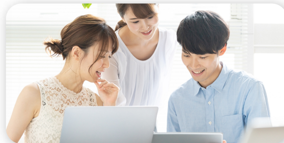
40分時間制限の撤廃