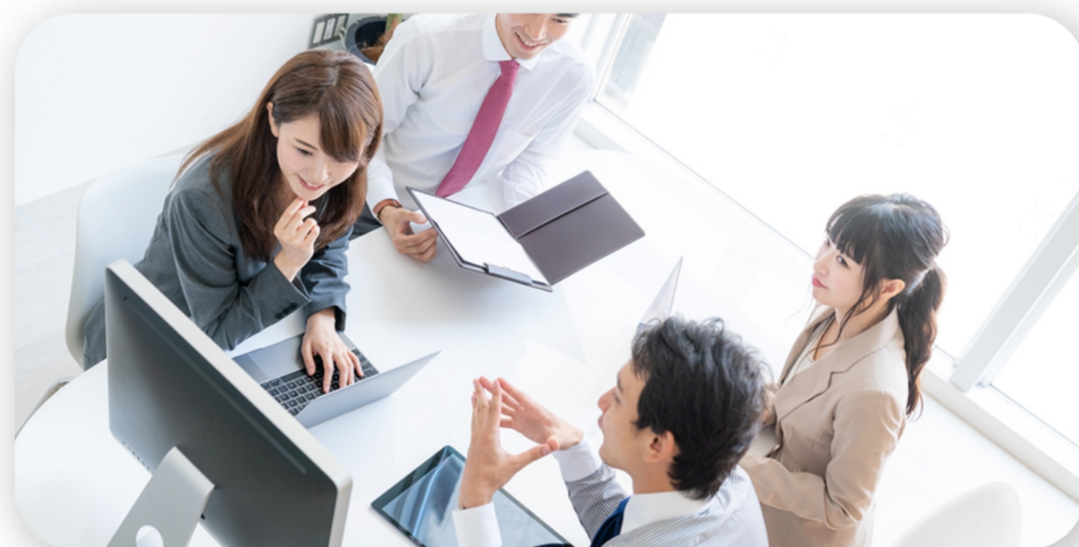
驚きの高品質と使いやすさ