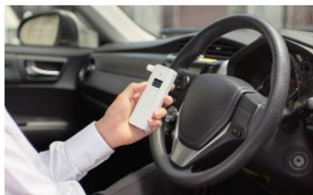
運転前後のセルフチェックに