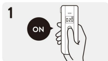
電源ON後、BAC10は20秒、 BAC100は10秒待機