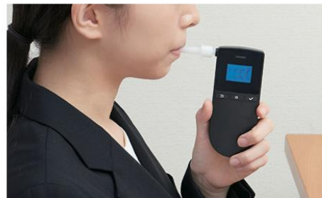
吹き込みやすいマウスピース付き ※マウスピースなしでもご使用いただけます。