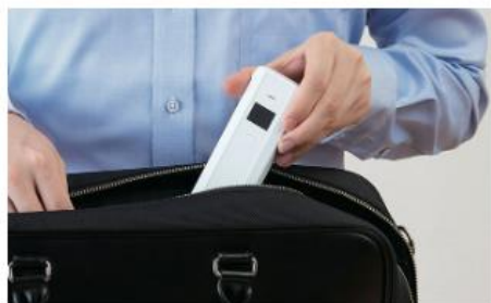
携帯しやすいコンパクトサイズ

「アルコールチェッカー」は息を吹き込むだけで、酒気帯びの有無を簡単にセルフチェックできます。